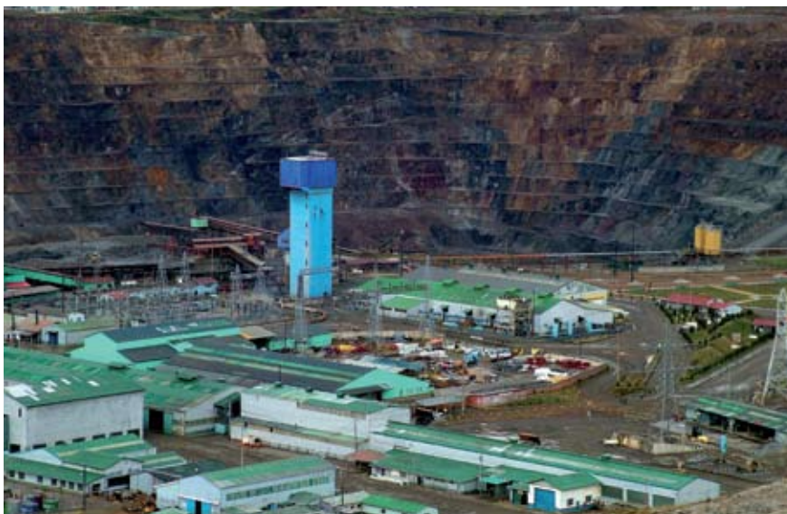
Mina Cerro de Pasco | Cerro de Pasco Mine